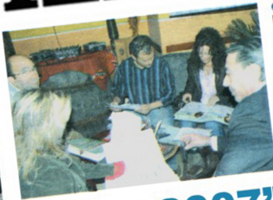
CONCORSO I giovani cantanti selezionati per le semifinali e la giuria al lavoro